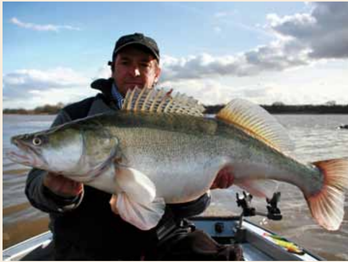
Pionieren en je eigen weg gaan levert vaak mooie vissen op.

informatie delen. Stel je open voor anderen, wees vooral niet betweterig en spreek met collega-vissers af om te gaan vissen. Je kunt namelijk van iedereen wat leren.