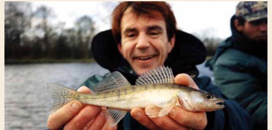
Blijven genieten, ook van kleine vissen, is het belangrijkste van onze mooie liefhebberij.

onder de knie te krijgen en, misschien wel het belangrijkste, je boot maximaal onder controle leert te houden. Puur en alleen door heel veel uren te maken, zoveel mogelijk wateren te bevissen en van alles uit te proberen word je een ervaren visser en zul je uiteindelijk meer gaan vangen! Dit is een jarenlang proces. Dat er dan af en toe een kneiter bij zit is mooi meegenomen, maar niet het belangrijkste. Dat is het blijven genieten van die onbetaalbaar mooie dagen die je op het water mag zitten! “Just being there is enough” is een mooie oneliner die we ooit eens voorbij hoorden komen. En als je dan ook nog af en toe een knappe vis vangt, hebben we toch de allerbeste hobby die er bestaat?! ◀