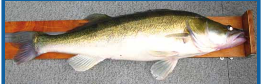
Goed meten is weten en noodzakelijk bewijs om op de lijst te komen.

Onder het motto 'eerst zien, dan geloven', werd meteen als regel ingesteld dat iedere kneitervangst van een foto vergezeld moest gaan. Geen foto, geen vermelding! Omdat de meeste deelnemers ook al regelmatig aan wedstrijden van het Nederlands Kampioenschap Snoekbaarsvissen (NKS) meededen – en vaak nog steeds doen – was er doorgaans een goede meetplank aanwezig zodat er secuur kon worden gemeten. Ben je alleen op het water en vang je een kneiter, dan dient er een foto op de meetplank overlegd te worden.