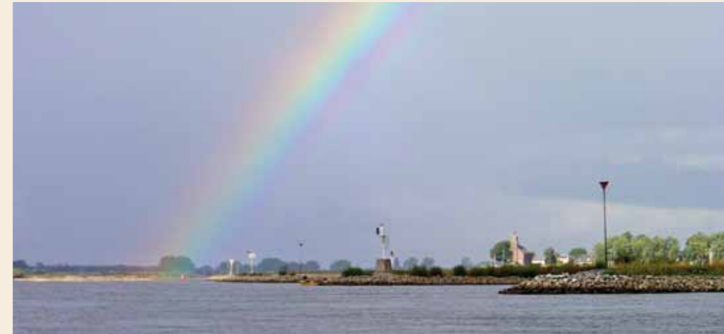
De grote rivieren herbergen de spreekwoordelijke pot met goud als het om kneiters van snoekbaarsen gaat.

leveren. Hoe het kan dat een water een bestand aan louter grote vissen lijkt te herbergen, is onduidelijk. Want hoe is het nou mogelijk dat wanneer je op één dag een paar vissen vangt, deze wel allemaal groter dan 70 cm zijn? Dat is diverse kneiterjunkies meerdere keren gebeurd en zeker geen toeval meer. Het is daar vaak wel een taaie visserij, maar weet je een dergelijk water ga het dan proberen en houd vol. Want één ding is zeker: snoekbaars is als onkruid. Ze zitten overal!