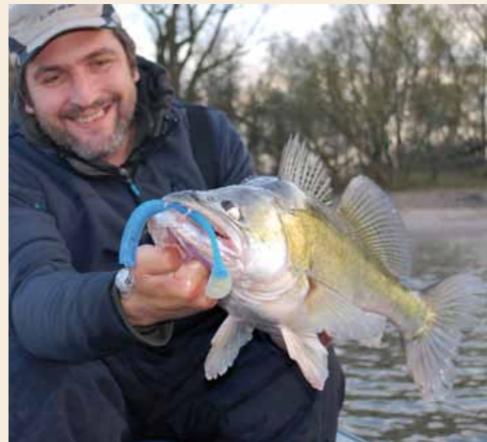
Groot (kunst)jaas levert doorgaans ook grote vis op.

grote vissen te vangen. Toch leert de ervaring van tien jaar Kneiterlijst dat er bepaalde wateren zijn waar je duidelijk meer kans maakt op een echt groot stekelvarkentje dan elders. Zo herbergen de grote rivieren aanzienlijk meer echte kanjervissen, want nergens in Nederland worden de snoekbaarsen zo groot en zwaar als op het stromende en voedselrijke water. Het vissen op de rivieren is echter nogal taai. Uitzonderingen daargelaten doe je het met een vis of vijftien per dag per boot prima. Dat maakt de visserij ook meteen een stuk lastiger, maar de beloning in de vorm van een mooie dikke vis zal waarschijnlijk wel meer bevrediging geven. Een dag gericht bikkelen en afzien voor één kneiter geeft veel doorgewinterde snoekbaarsvissers vaak meer voldoening dan veertig visjes op een dag – al is het na een paar blanco bikkeldagen natuurlijk ook wel weer erg leuk om veel beet te krijgen. Naast de grote rivieren telt ons land nog meer wateren die een bestand van ‘minder maar wel grote’ snoekbaars huisvesten. Neem bijvoorbeeld de wateren die de laatste jaren helder zijn geworden en waar de bestanden om wat voor reden dan ook zijn teruggelopen. Deze kunnen na langere tijd toch ineens weer zeer verrassend de ene na de andere mooie vis op-