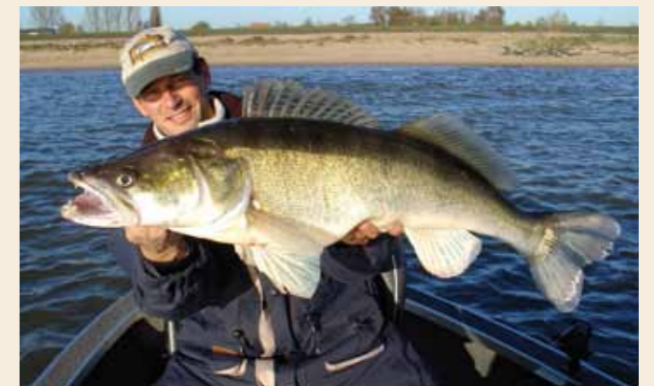
Informatie uitwisselen en kennis delen zijn belangrijke sleutels tot succes.

bepalend voor hoeveel visuren je maakt. Niet afhaken als de watertemperatuur onder het vriespunt komt, het regent of te hard waait; maar juist stug volhouden en doorzetten in zeikweer kunnen vaak net die ene kneiter opleveren. Vis toch nog even dat extra uurtje door in de schemer, ga een uurtje eerder je bed uit zodat je extra vroeg kunt beginnen en zoek bij verkeerde wind of extreme weersomstandigheden een alternatief water uit waar je toch veilig kan vissen. Blijf in elk geval niet thuis! Ook niet als