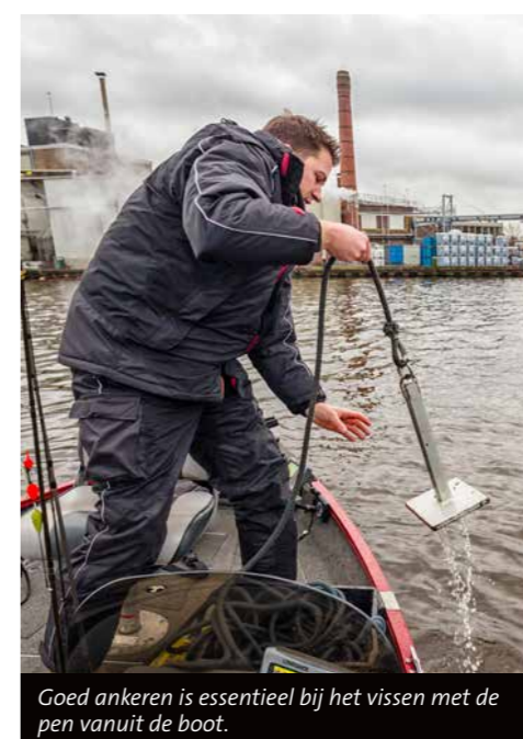
Goed ankeren is essentieel bij het vissen met de pen vanuit de boot.